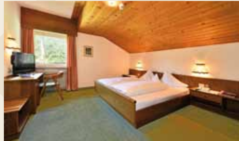
St. Georgen ohne Balkon