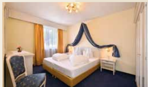
Suite Elisabeth Südbalkon